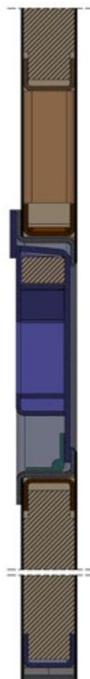
Coupe de la partie basse