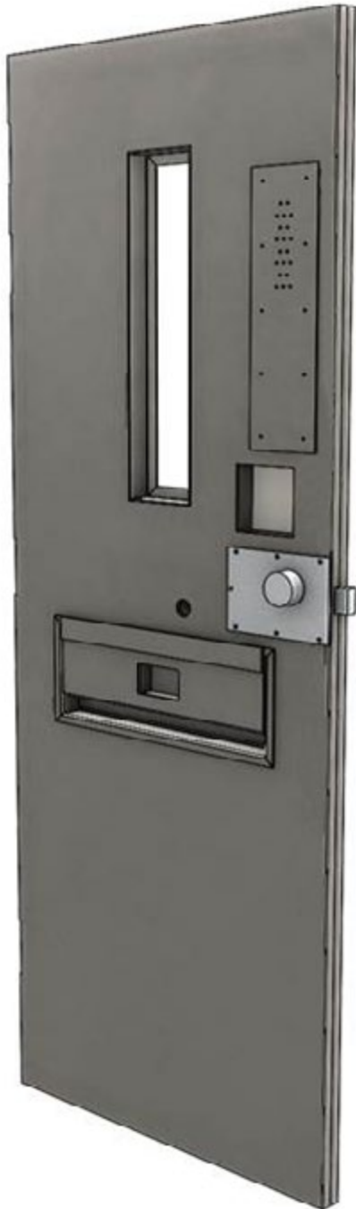
Vue côté non-sécuritaire