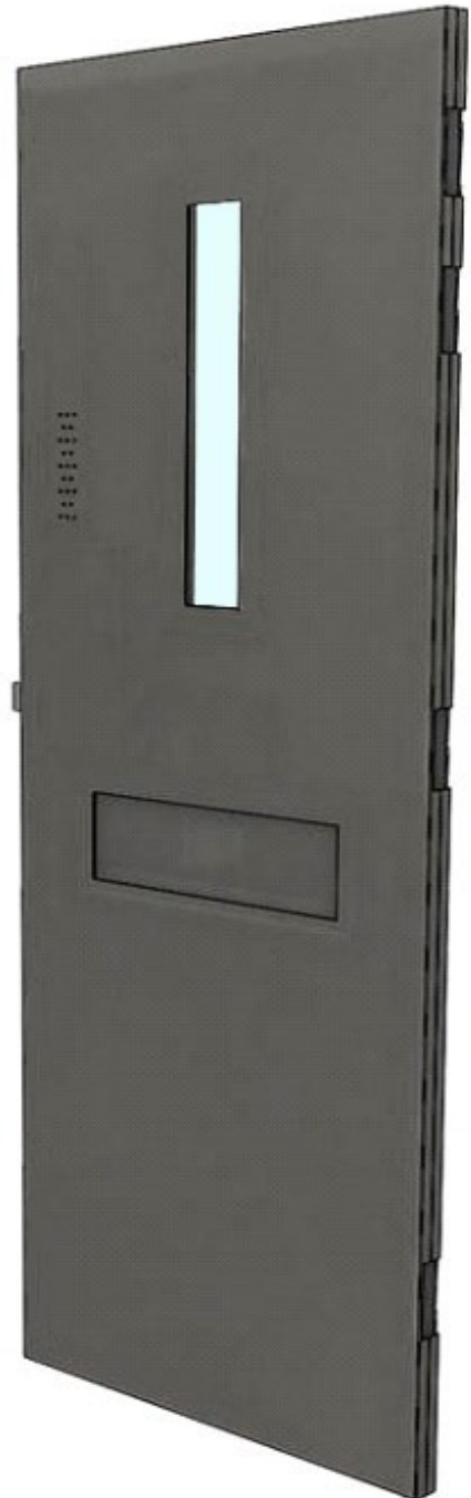
Vue côté sécuritaire